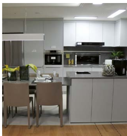
Corée du Sud, Séoul Gaepo Raemian Forest

Installation : à partir de juin 2025, achèvement prévu en automne 2025