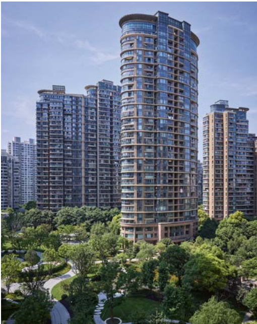
Chine, Shanghai New Lake Pearl City

Projets résidentiels à Barcelone ou cuisine familiale à Rödinghausen, les cuisines Häcker rayonnent aux quatre coins du monde. Nos projets illustrent la diversité avec laquelle nous créons – de l'appartement de ville à la villa d'architecte. En Europe, en Asie, en Amérique ou en Océanie, nos partenaires sont séduits par notre alliance entre qualité allemande, accompagnement régional et fiabilité logistique.