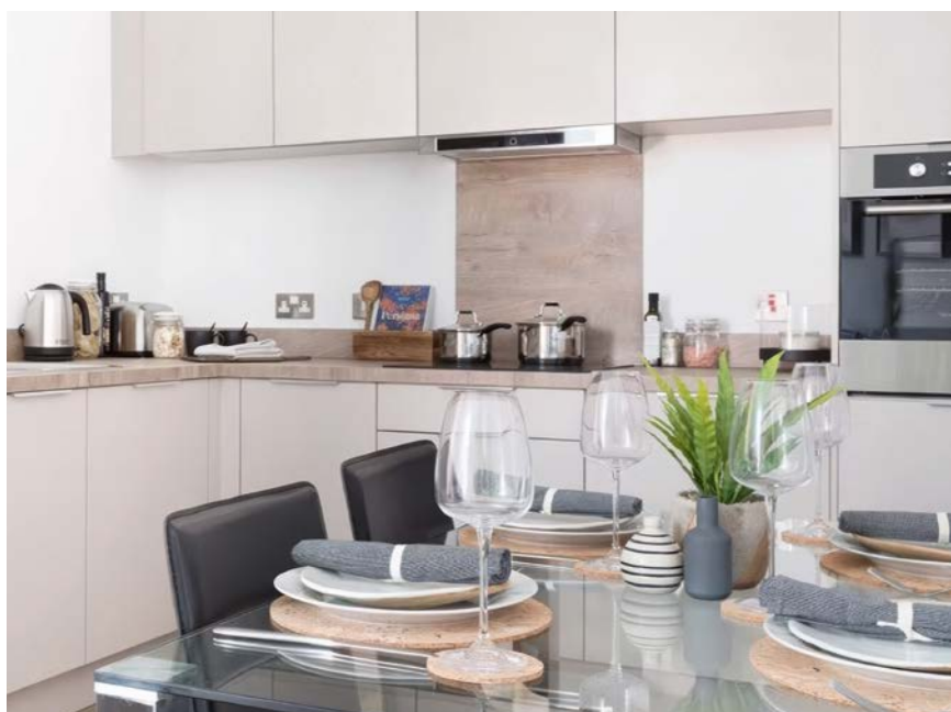
Royaume-Uni, Birmingham Exchange Square

Nombre de cuisines : 47 Installation : 2021