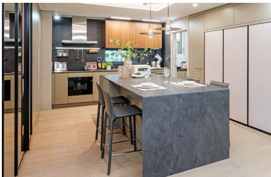
Corée du Sud, Séoul The H Bangbae