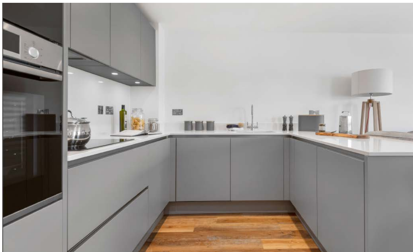
Royaume-Uni, Bury St Edmunds Tayfen Road

Nombre de cuisines : 47 Installation : 2021