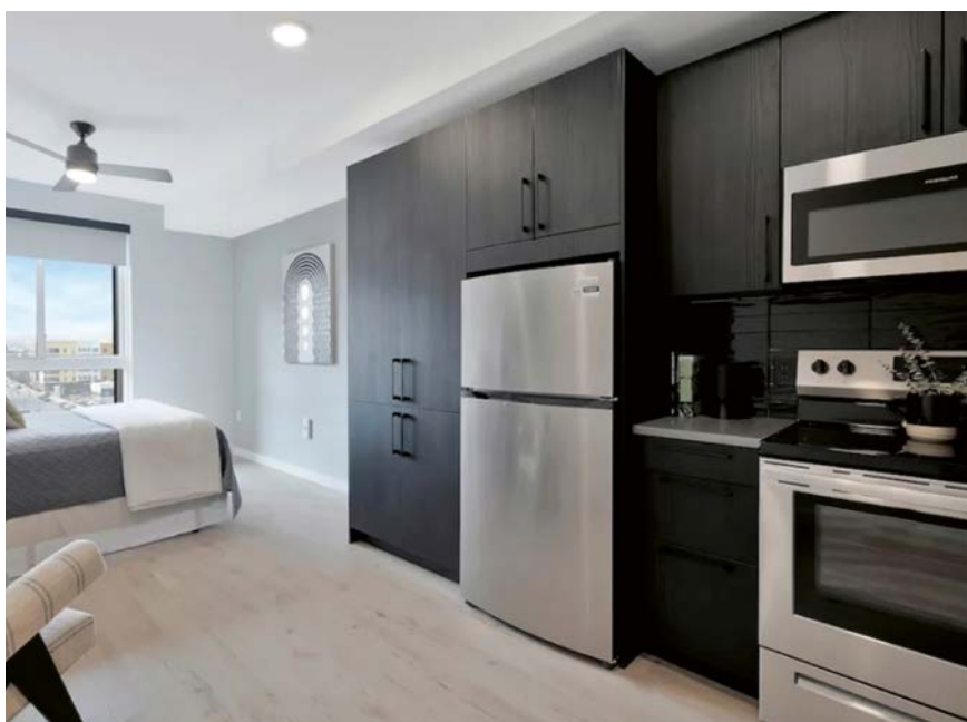
États-Unis, Birmingham, Alabama Citizen – Smart Apartment

Nombre de cuisines : 62 Installation : 2020