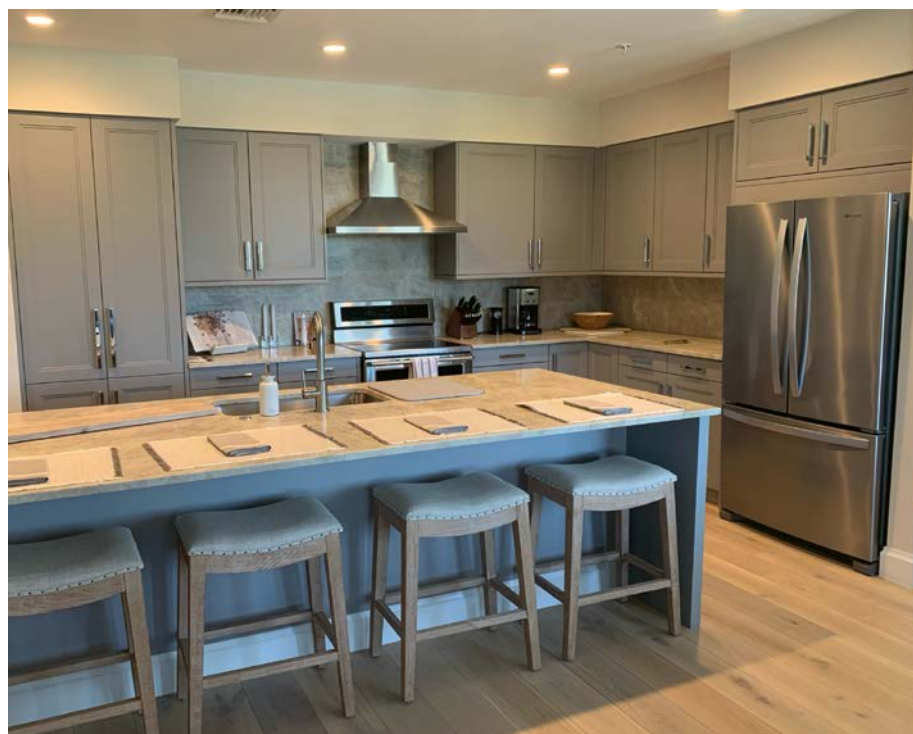
États-Unis, Naples, Florida BCBE

Nombre de cuisines : 62 Installation : 2020