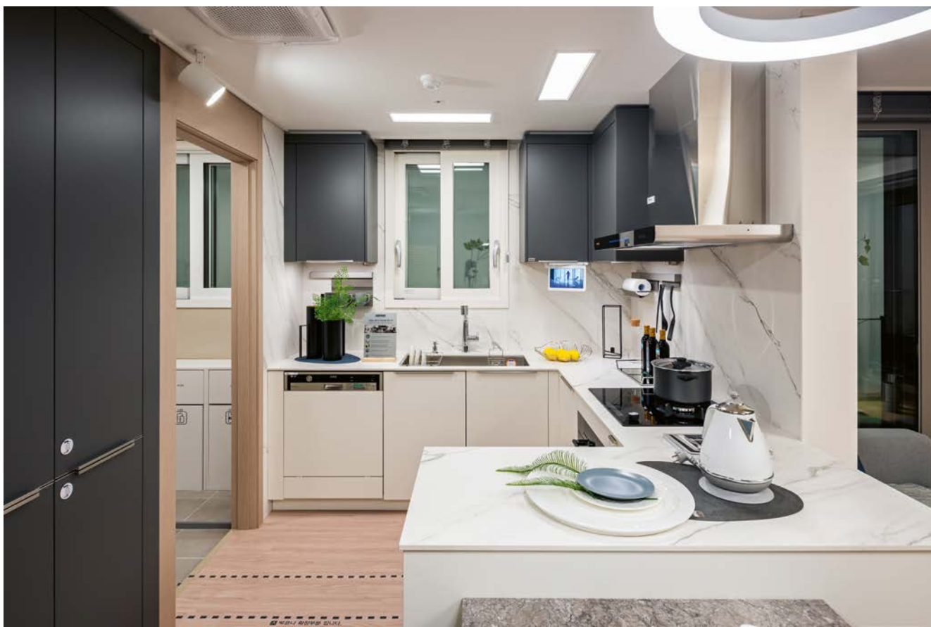
Corée du Sud, Séoul Seocho GranXi

Nombre de cuisines : 1 154 Installation : 2020