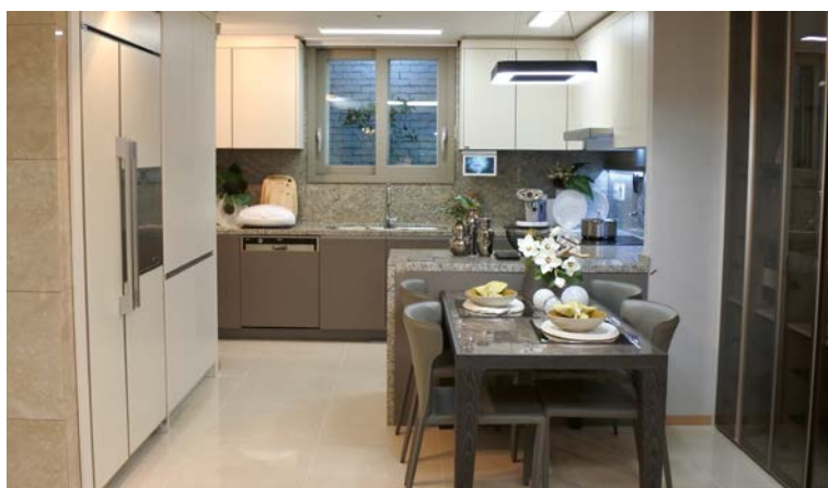
Corée du Sud, Séoul Banpo Central Xi