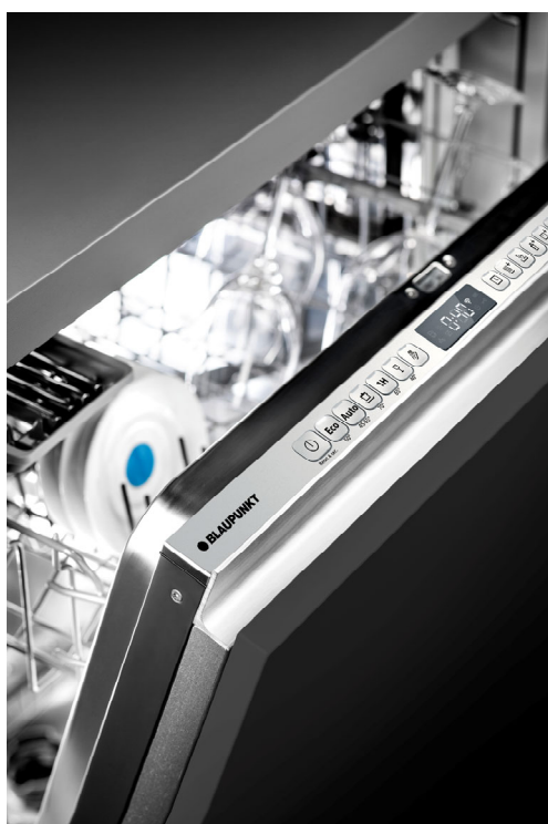
Image 2 : Lave-vaisselle Blaupunkt 5VH6X00VSB avec éclairage intérieur

Les nouveautés de Blaupunkt comprennent également des lave-vaisselle particulièrement discrets, avec un niveau de bruit de 39 décibels seulement (équivalant à un chuchotement), et pouvant être intégrés avec des hauteurs de socle très faibles.