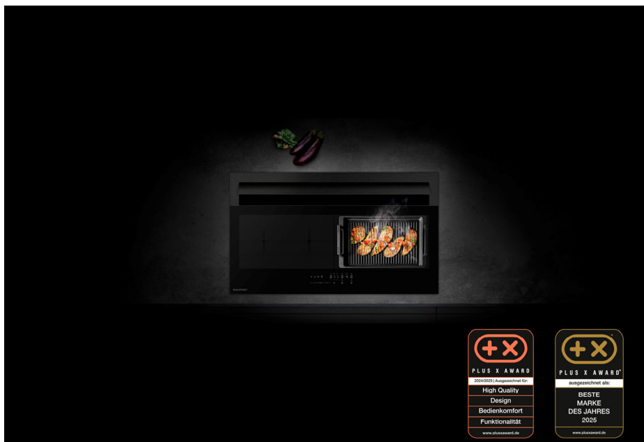
Bild 1: Induktionskochfeld mit integriertem Dunstabzug 5IX99300 im Einsatz

Rödinghausen. Die Fachjury der renommierten Plus X Awards zeichnete Anfang dieses Jahres das Induktionskochfeld mit integriertem Dunstabzug 5IX99300 von Blaupunkt als „Bestes Produkt des Jahres 2025“ aus. Zusätzlich verlieh die Jury Blaupunkt die Sonderauszeichnung „Beste Marke des Jahres 2025“.