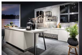
AV 7000-GL Echtbeton natur