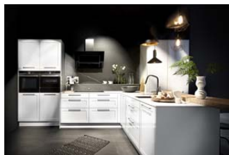
AV 5040 Weiß