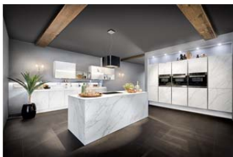
AV 8000-GL Calcatta