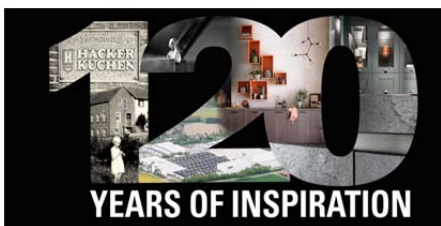
Häcker: "120 years of inspiration"