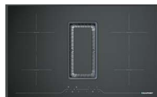
Muldenlüfter m. zentr. Dunstabzug, 5IX90290