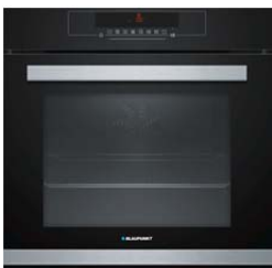
Backofen mit Smart Slider, 5B49M8160