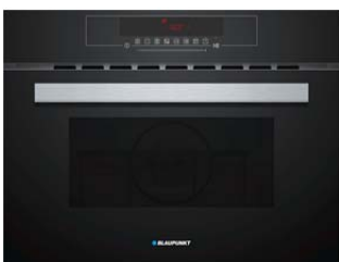
Mikrowellen-Kompaktbackofen mit Schwarzglas, 5C49K1860