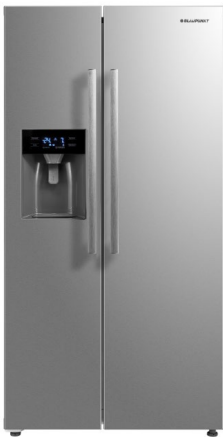
Side-by-Side Kühl- und Gefrierkombination